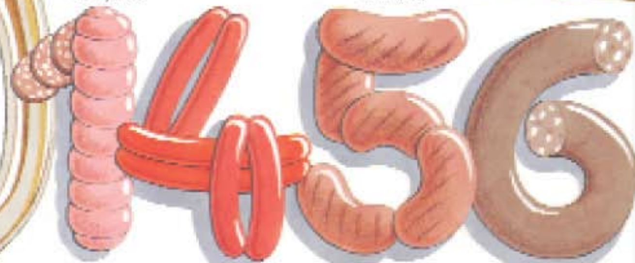
soorten worst in Duitsland