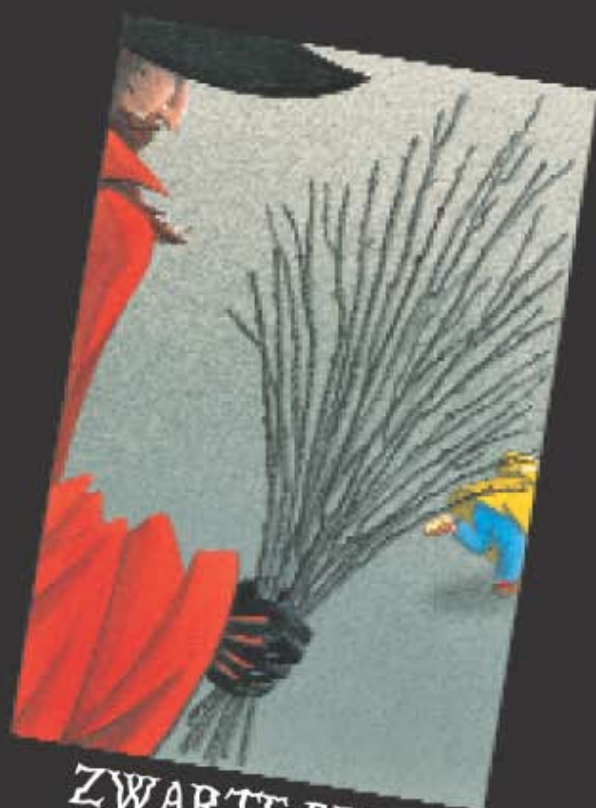
ZWARTE PIET BELGIË