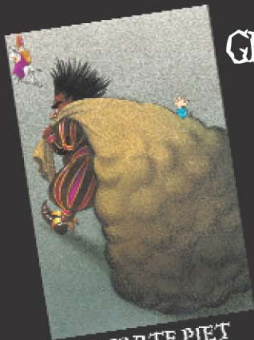
ZWARTE PIET NEDERLAND