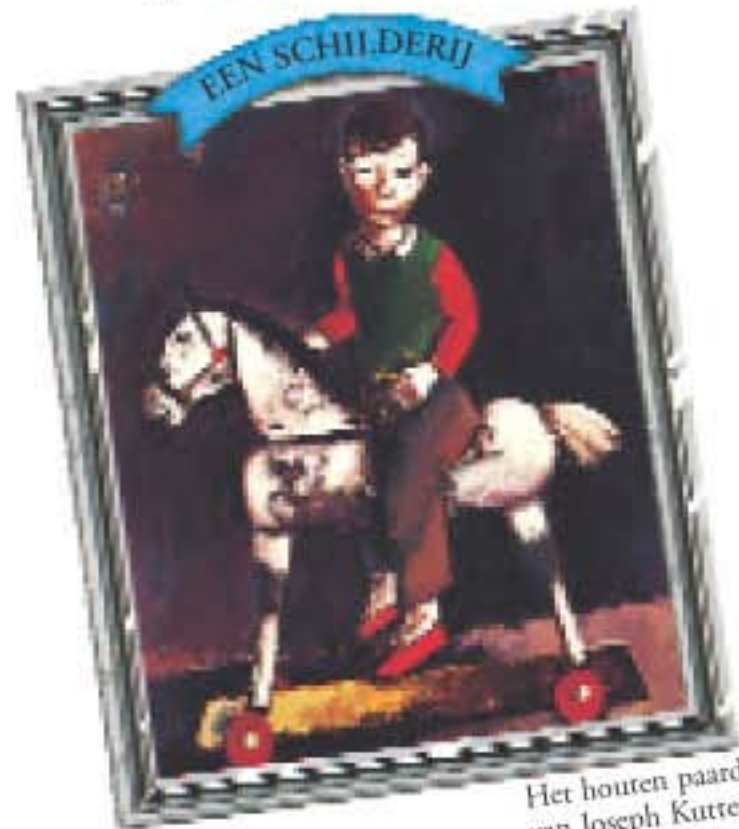
Het houten paard van Joseph Kutter

Ik woon in de stad Luxemburg, de hoofdstad die vol staat met oude kastelen, wallen, bruggen (93!) en kelders.