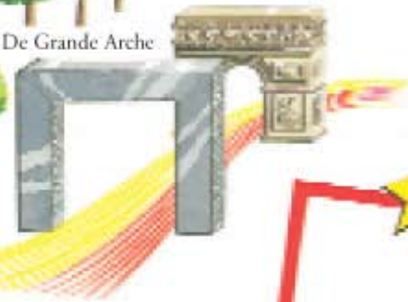
De Arc de Triomphe

Parijs is de hoofdstad van de mode. Enkele grote couturiers zijn: Chanel, Dior, Lacroix en Saint Laurent.