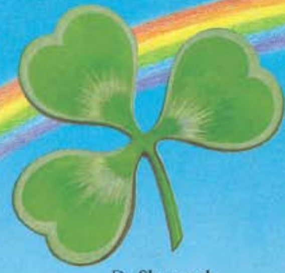
De Shamrock, symbool van Ierland