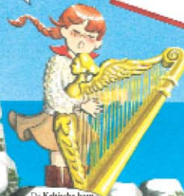
De Keltische harp is het symbool van Ierland.

Een bull's eye of stierenoog, een snoepje dat naar pepermunt smaakt.