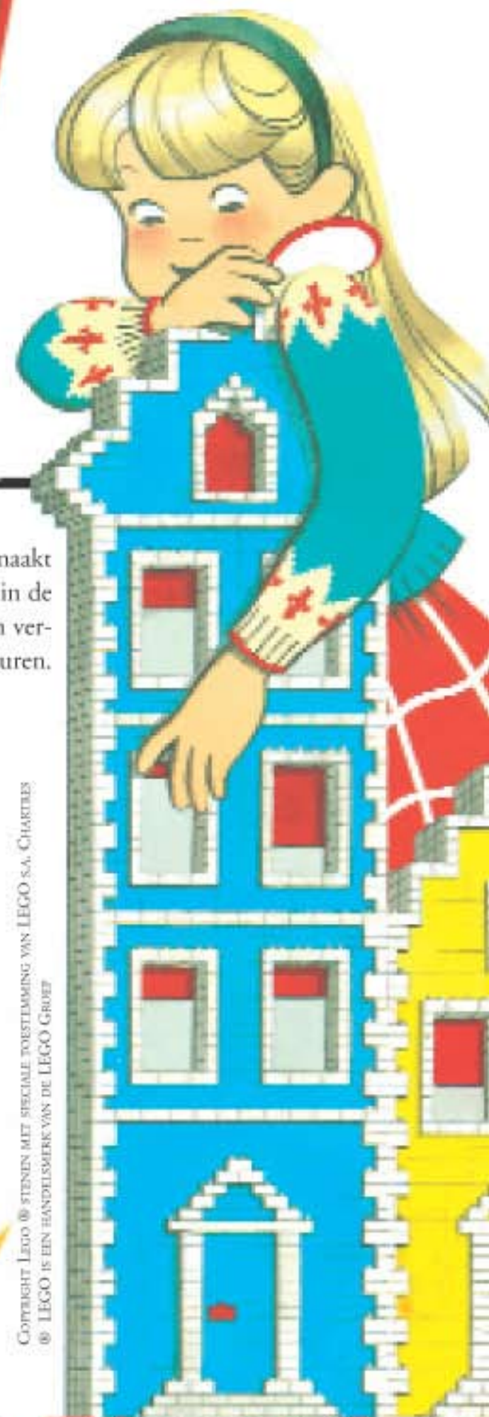
COPYRIGHT LEGO © STENEN MET SPECIALE TOESTELING VAN LEGO S.A. CHARLES © LEGO IS EEN HANDELSMERK VAN DE LEGO GROEP