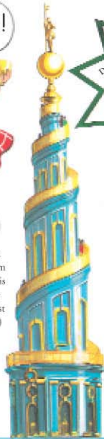
De kerk van de Redder