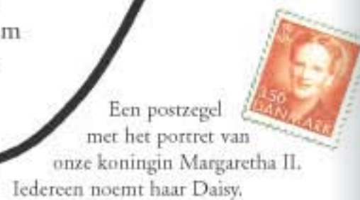
Een postzegel met het portret van onze koningin Margaretha II. Iedereen noemt haar Daisy.

Met Pasen stuurt iedereen 'plaagbrieven', een soort raadsel-gedichtjes op uitgeknipt papier. Je moet raden wie hem gestuurd heeft, anders kost het je een chocolade-ei. Ze stoppen een sneeuwkllokje in de enveloppe.