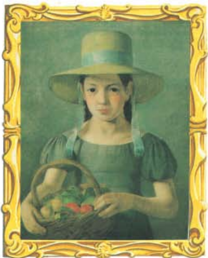
Meisje met fruitmand van Constantin Hansen.

Peter het spinnetje klom op de muur Toen kwam de regen en spoelde hem weg Toen kwam de zon en maakte hem weer droog En Peter het spinnetje klom toen weer omhoog.